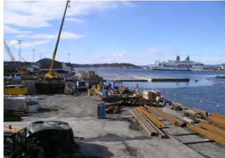
Bjorvika Fjord Tunnel, Oslo, NO Bjorvika Fjord Tunnel, Oslo, NO