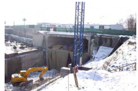
Erweiterung Metrolinie 1, Sofia, BG Expansion Metro Line 1, Sofia, BG