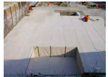
Bentonitmatte CEMtbent DS Bentonite Waterproofing Liner CEMtbent DS