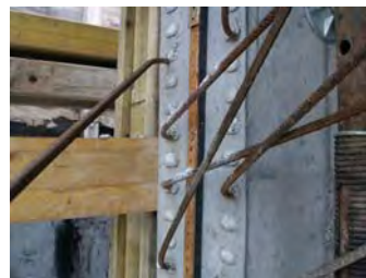
Quellfugenband Quellmax Blackstop Swellable Bentonite Waterstop Tape Quellmax Blackstop