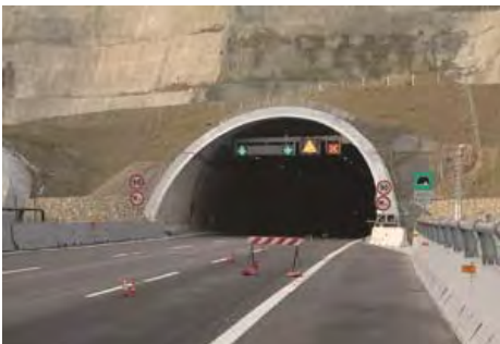
Variante di Valico, Firenze/Bologna, IT Variante di Valico, Firenze/Bologna, IT