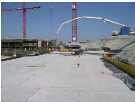
St. Martins Therme & Lodge, Frauenkirchen, AU St. Martins Therme & Lodge, Frauenkirchen, AU