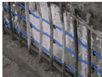
Verpressschlauch CEM Injection Tube CEM