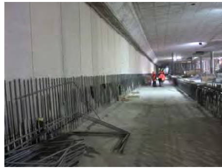
Bahnhof Löwenstraße, Zürich, CH Central Station Löwenstraße, Zürich, CH