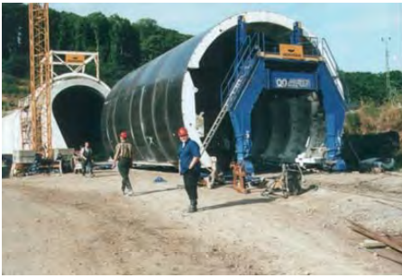
Hallandsås Tunnel, Förslöv/Båstad, SWE Hallandsås Tunnel, Förslöv/Båstad, SWE