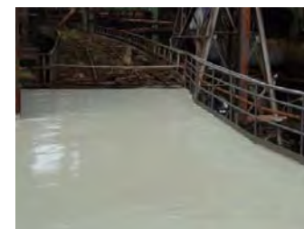
Flüssigfolie Liquid Seal