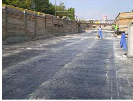
Tunnel B10/Pragsattel, Stuttgart, GER Tunnel B10/Pragsattel, Stuttgart, GER