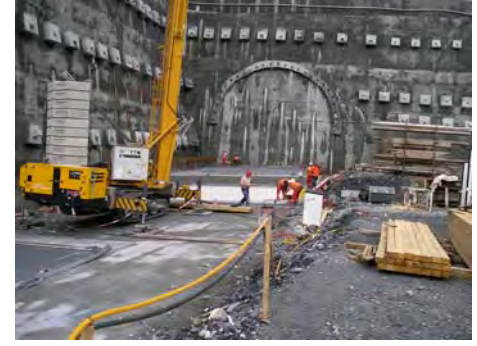
Küblitunnel, Küblis, CH Küblis Tunnel, Küblis, CH