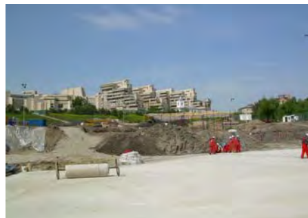
Shopping Center „Palais“, Iași, RO Shopping Center „Palais“, Iași, RO