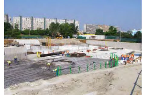
Abu Dhabi, UAE Abu Dhabi, UAE