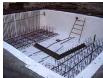
Quellvlies SilverSeal Swelling Non-Woven SilverSeal