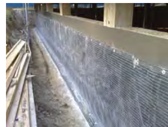
Bentonitmatte CEMtbent CS Plus Bentonite Waterproofing Liner CEMtbent CS Plus