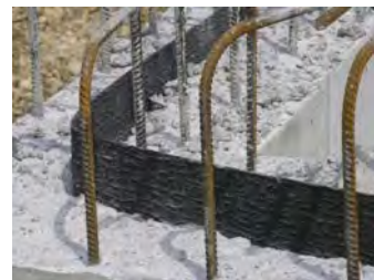
Fugenblech CEMflex VB Steel Plate Waterstop CEMflex VB