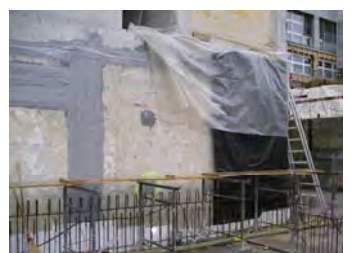
Dichtmasse AQUA STOP Sealing Compound AQUA STOP