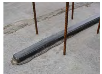
Quellfugenband Quellmax Plus Swellable Bentonite Waterstop Tape Quellmax Plus