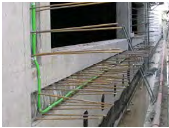
Injektionsschlauch PREDIMAX Injection Hose Predimax