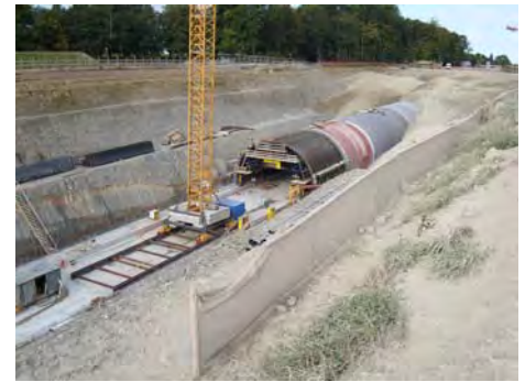
Neufeld Tunnel, Bern, CH Neufeld Tunnel, Bern, CH