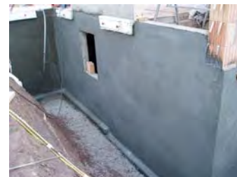
Dichtungsschlämme CEMdicht 3 in 1 Waterproofing Slurry CEMdicht 3 in 1