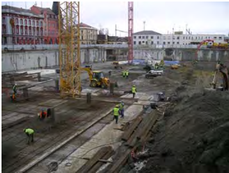
Hotel Mercure, Budweis, CZ Hotel Mercure, Budweis, CZ